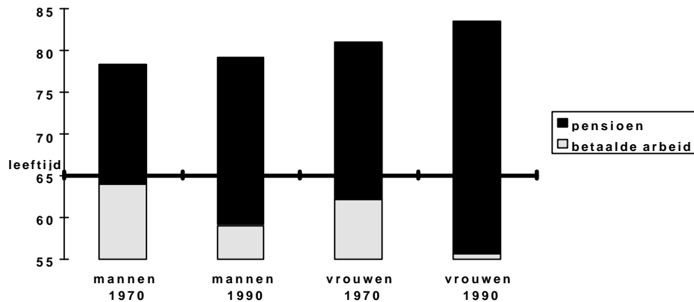
Figuur 1 Daling pensioenleeftijd en stijging levensverwachting voor mannen en vrouwen, van 1970 tot 1990

Bron: CBS, diverse publicaties over bevolkingstatistieken; SZW, Income benefits for early exit from the labour market in eight European countries , Den Haag, 1997; bewerking SZW.